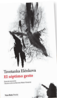
El séptimo gesto Autora: Tsvetanka Elénkova Género: Poesía Editorial: Vaso Roto, 2021

El séptimo gesto (Vaso Roto, 2021): primera edición en castellano de poemas de Tsvetanka Elénkova (traducción directa del búlgaro por Reynol Pérez Vázquez). Volumen bilingüe que acerca al lector a una de las tradiciones poéticas más sugerentes del sureste europeo: encuentro con las humedecidas raíces en las aguas del Danubio y el mar Negro. En español conocemos los apasionantes poemas de amor de Peyo Kracholov Yávorov, y asimismo tenemos noticias de versiones de textos de Pavlova, Lukov, Levi, Gatseva y Milev, entre otros trascendentes bardos búlgaros. Lírica cautivadora en la runa de su temática. Tsvetanka Elénkova constituye una gran sorpresa para los lectores de lengua española.