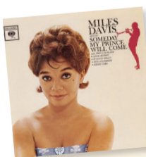
Someday My Prince Will Come Artista: Miles Davis Sextet Género: Jazz Sello: Columbia Records

A diferencia de Kind of Blue (1959), con temas originales de Davis, en este álbum se intercalan obras del trompetista con estándares pop, incluida la pieza principal tomada de Blancanieves y los siete enanitos (Disney,